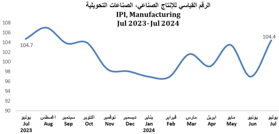
رسم بياني (4) Graph(4)